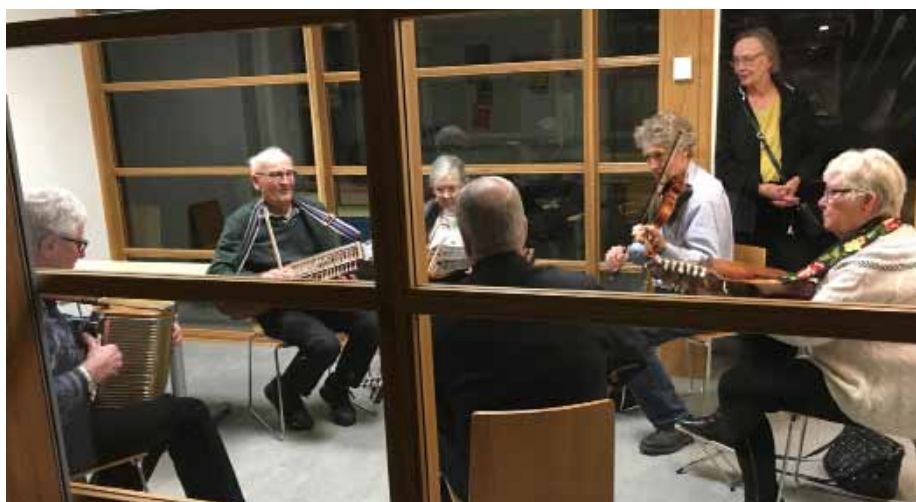
Buskspel efter årsmöte