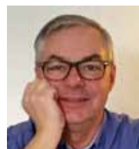
Ola Wirtberg Layout fr o m Nr 4 2015.