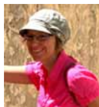
Sanna Marcus Svalfeldt Layout t o m Nr 3 2015