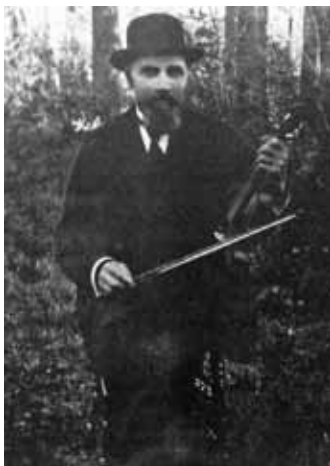
Ett fördjupningsarbete av