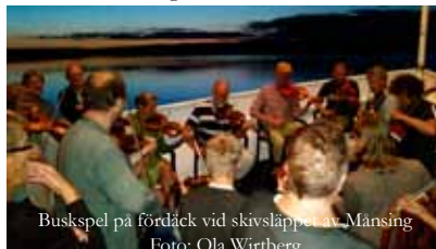
Buskspel på fördäck vid skivsläppet av Mansing

Sommaren är till ända. För min del har den varit underbar och på olika sätt nästan överfylld av fantastiska folkmusikaliska äventyr. Skivsläpp under fullmåne i spegelblankt Vättern; lossdragning av husbilar från Woodstockfestivalsliknande leråkrar; euforiska nattjam i buskar å vrår; getingöversållade mazariner till kaffet; fantastiska konserter med nya såväl som gamla luttrade spelhenner... Ja det har varit underbart. Men nu är jag trött, och lite söndrig faktiskt. Ont i fötter och knän.