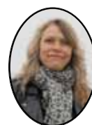
Annonsansvarig Ann-Katrin Hellner