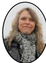
Annonsansvarig Ann-Katrin Hellner