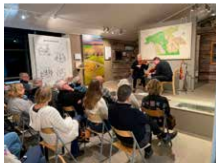
Konsert i Fjärås.

Ett projekt av den här digniteten kan inte genomföras utan hjälp. Bidragsgivare är bland annat Riksantikvarieämbetet, Kulturrådet, ABF Västra Götaland och en rad stiftelser. VSF står tillsammans med Västergötlands hembygdsförbund och Svenskt Visarkiv som medarrangör till konsertserien.